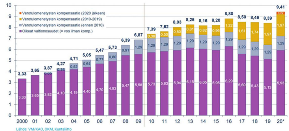
Kuntien valtionosuudet 2000-2019, mrd. €