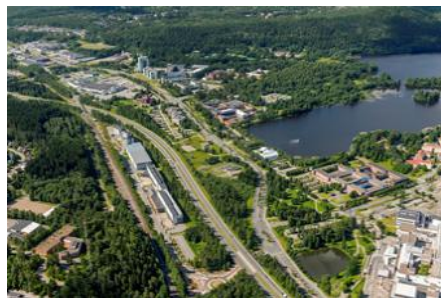
Figur: Lentokuva Valla Oy

I projektet som genomfördes som en del stadsplaneringsprojektet utreddes möjligheten att använda sol- och geoenergi samt användningen av smart fastighetsautomation i Savilahti-området