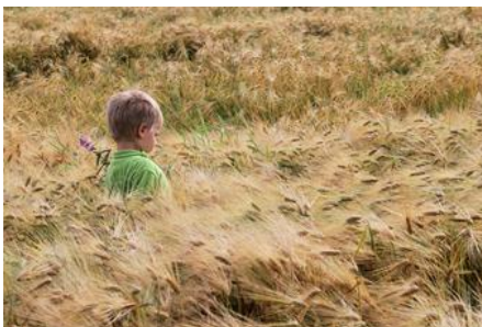
Figur: Heidi Huhtilainen

Närmat och ekologiska livsmedel ingår i stadens strategi och målet är att de ska få en större roll i stadens kostservice