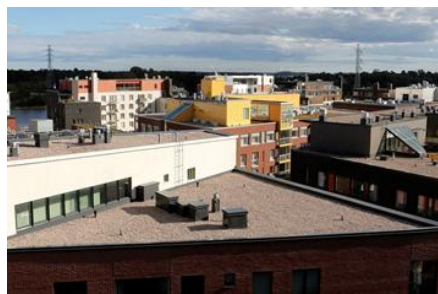
Figur: Laura Oja

Staden, dess energibolag och teknologiföretag har tillsammans skapat ett modellområde för energismarta system