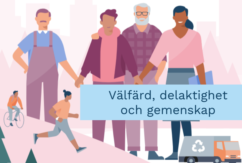
Välfärd, delaktighet och gemenskap