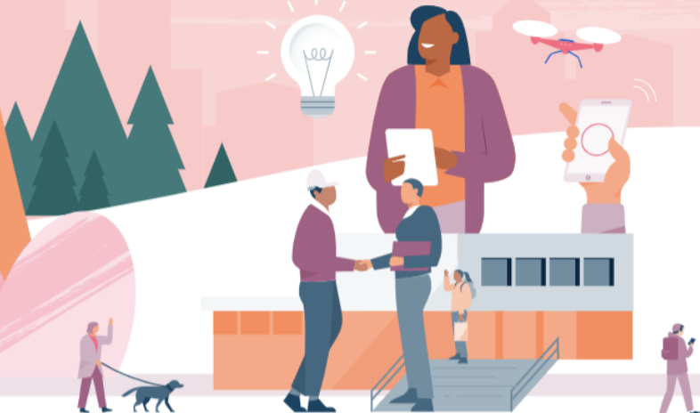
Näringsliv och sysselsättning