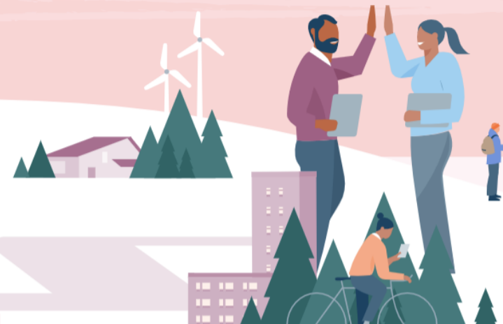
Utvecklare och partner