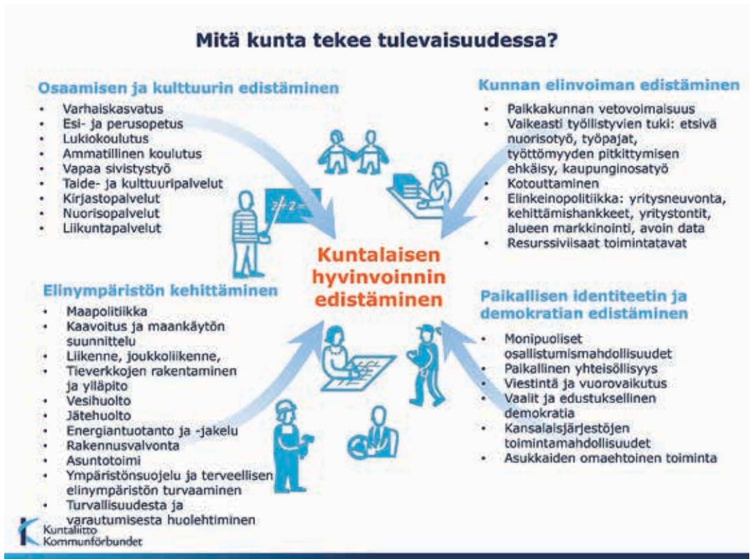
Kuva 3. Tulevaisuuden kunnan tehtävät (Kuntaliitto).

teensa ja kuntalaisten tarpeiden perusteella laajenevat. Alkavatko kunnat profiloitua kiihtyvällä tahdilla terveellisen ja viihtyisän elinympäristön tarjoajina tai vaikkapa kiertotalouden ja hiilineutraaliuden edelläkävijöinä, jää tulevien kuntavaalien jälkeen nähtäväksi. Kuntien keskeisimmiksi tehtäväkokonaisuuksiksi nähdään joka tapauksessa kuntalainkin pohjalta kuntalaisten hyvinvoinnin ja terveyden sekä kunnan elinvoiman edistäminen. Näissä molemmissa kokonaisuuksissa ympäristönsuojelulla on tärkeä rooli niin terveellisen ja viihtyisän elinympäristön kehittäjänä kuin resurssiviisaisten toimintatapojen käyttöön oton tukijana kunnan omassa toiminnassa, kuntalaisten palveluissa ja yritys yhteistyössä. Tulevaisuuden kuntien tehtäväkenttä tulee olemaan moninainen (kuva 3) ja elinympäristöroolin merkityksen voidaan uskoa nykyisestä korostuvan.